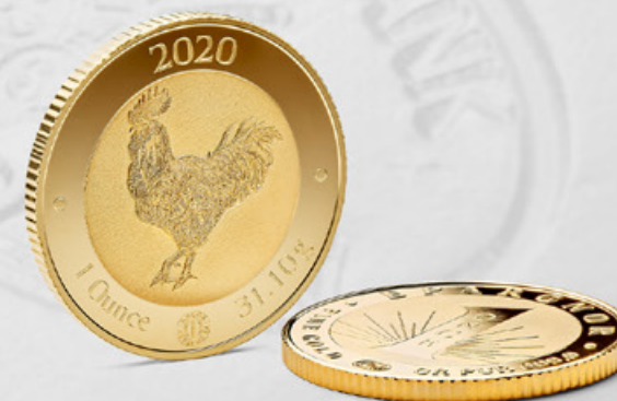
1 once EpargnOr

L'once EpargnOr est aussi composée d'or dit « Good Delivery » (de bonne livraison), standard de qualité acquis auprès de la London Bullion Market Association (LBMA) .