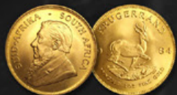
KRUGERRAND TITRE: 917.00 ‰ | DIAMÈTRE: 32mm POIDS BRUT: 33,93g | POIDS NET: 31,11g