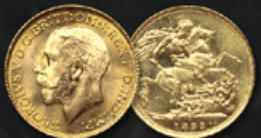
SOVERAIN TITRE: 917.00 ‰ | DIAMÈTRE: 22mm POIDS BRUT: 7,98g | POIDS NET: 7,32g