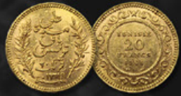
20 FRANCS TUNISIE TITRE: 900.00 ‰ | DIAMÈTRE: 21mm POIDS BRUT: 6,45g | POIDS NET: 5,81g