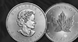
MAPLE LEAF CANADA TITRE: 999.90 ‰ | DIAMÈTRE: 38mm POIDS BRUT: 31,104g