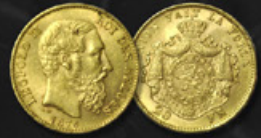
UNION LATINE TITRE: 900.00 ‰ | DIAMÈTRE: 21mm POIDS BRUT: 6,45g | POIDS NET: 5,81g