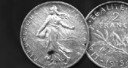
2 FRANCS SEMEUSE 1898-1920 TITRE: 835.00 ‰ | DIAMÈTRE: 27mm POIDS BRUT: 10g