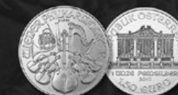
PHILHARMONIQUE AUTRICHE TITRE: 999.90 ‰ | DIAMÈTRE: 37mm POIDS BRUT: 31,104g