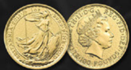
BRITANNIA ANGLETERRE TITRE: 999.90 ‰ | DIAMÈTRE: 32mm POIDS BRUT: 31,104g Disponible en 1, 1/2, 1/4 et 1/10 oz