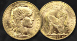
20 FRANCS MARIANNE TITRE: 900.00 ‰ | DIAMÈTRE: 21mm POIDS BRUT: 6,45g | POIDS NET: 5,81g