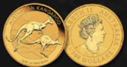
NUGGET 1 ONCE OR AUSTRALIE TITRE: 999.90 ‰ | DIAMÈTRE: 33mm POIDS BRUT: 31,104g Disponible en 1, 1/2, 1/4 et 1/10 oz