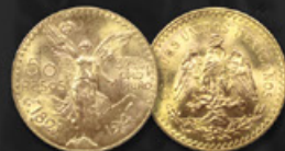
50 PESOS TITRE: 900.00 ‰ | DIAMÈTRE: 37mm POIDS BRUT: 41,65g | POIDS NET: 37,49g