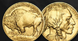
BUFFALO US TITRE: 999.90 ‰ | DIAMÈTRE: 32mm POIDS BRUT: 31,104g Disponible en 1, 1/2, 1/4 et 1/10 oz