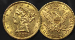
5 DOLLARS US TITRE: 900.00 ‰ | DIAMÈTRE: 22mm POIDS BRUT: 8,35g | POIDS NET: 7,32g