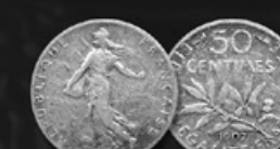
50 CTS SEMEUSE 1897-1920 TITRE: 835.00 ‰ | DIAMÈTRE: 18mm POIDS BRUT: 2,5g