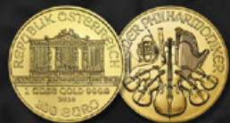
PHILHARMONIQUE AUTRICHE TITRE: 999.90 ‰ | DIAMÈTRE: 37mm POIDS BRUT: 31,104g Disponible en 1, 1/2, 1/4 et 1/10 oz