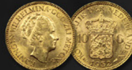
10 FLORINS TITRE: 900.00 ‰ | DIAMÈTRE: 22mm POIDS BRUT: 6,72g | POIDS NET: 6,05g