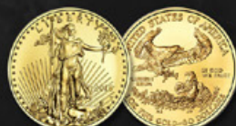
AMERICAN EAGLE US TITRE: 917.00 ‰ | DIAMÈTRE: 32mm POIDS BRUT: 33,915g Disponible en 1, 1/2, 1/4 et 1/10 oz