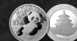
PANDA CHINE TITRE: 999.90 ‰ | DIAMÈTRE: 40mm POIDS BRUT: 30g