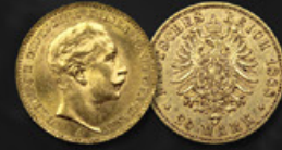
20 REICHSMARKS TITRE: 900.00 ‰ | DIAMÈTRE: 22mm POIDS BRUT: 7,96g | POIDS NET: 7,16g