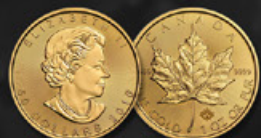
MAPLE LEAF CANADA TITRE: 999.90 ‰ | DIAMÈTRE: 30mm POIDS BRUT: 31,104g Disponible en 1, 1/2, 1/4 et 1/10 oz