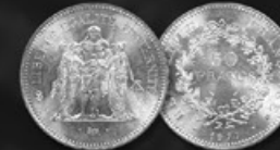
50 FRANCS HERCULE 1974-1980 TITRE: 900.00 ‰ | DIAMÈTRE: 41mm POIDS BRUT: 30g