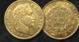
10 FRANCS NAPOLEÓN TITRE: 900.00 ‰ | DIAMÈTRE: 19mm POIDS BRUT: 3,22g | POIDS NET: 2,90g