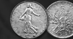
5 FRANCS SEMEUSE 1959-1969 TITRE: 835.00 ‰ | DIAMÈTRE: 29mm POIDS BRUT: 12g