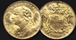
20 FRANCS SUISSE TITRE: 900.00 ‰ | DIAMÈTRE: 21mm POIDS BRUT: 6,45g | POIDS NET: 5,81g