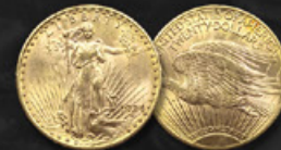
20 DOLLARS US TITRE: 900.00 ‰ | DIAMÈTRE: 34mm POIDS BRUT: 33,43g | POIDS NET: 30,09g