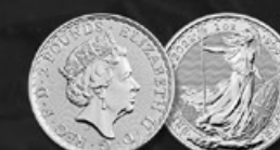
BRITANNIA 1 ONCE ROYAUME-UNI TITRE: 999.90 ‰ | DIAMÈTRE: 40mm POIDS BRUT: 31,104g