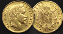
20 FRANCS NAPOLEÓN TITRE: 900.00 ‰ | DIAMÈTRE: 21mm POIDS BRUT: 6,45g | POIDS NET: 5,81g