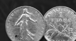
1 FRANC SEMEUSE 1898-1920 TITRE: 835.00 ‰ | DIAMÈTRE: 23mm POIDS BRUT: 5g