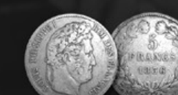
ECU 5 FRANCS 1795-1889 TITRE: 900.00 ‰ | DIAMÈTRE: 37mm POIDS BRUT: 25g