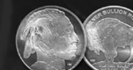
AMERICAN BUFALLO US TITRE: 999.90 ‰ | DIAMÈTRE: 39mm POIDS BRUT: 31,104g