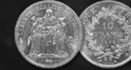
10 FRANCS HERCULE 1964-1973 TITRE: 900.00 ‰ | DIAMÈTRE: 37mm POIDS BRUT: 25g