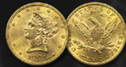
10 DOLLARS US TITRE: 900.00 ‰ | DIAMÈTRE: 27mm POIDS BRUT: 16,71g | POIDS NET: 15,04g