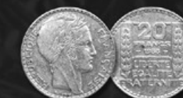
20 FRANCS TURIN 1929-1939 TITRE: 680.00 ‰ | DIAMÈTRE: 35mm POIDS BRUT: 20g