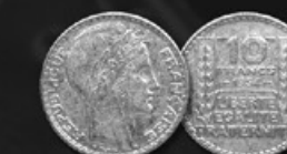
10 FRANCS TURIN 1929-1939 TITRE: 680.00 ‰ | DIAMÈTRE: 28mm POIDS BRUT: 10g