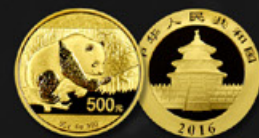
PANDA CHINE TITRE: 999.90 ‰ | DIAMÈTRE: 32mm POIDS BRUT: 30g Disponible en 30, 15, 8 et 3 g