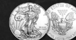
AMERICAN EAGLE US TITRE: 999.90 ‰ | DIAMÈTRE: 40mm POIDS BRUT: 31,104g