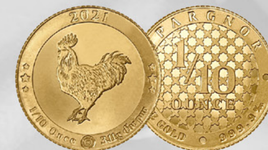
1/10 once EpargnOr